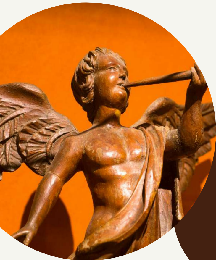
Ange, s.d., bois, Coll. dép.