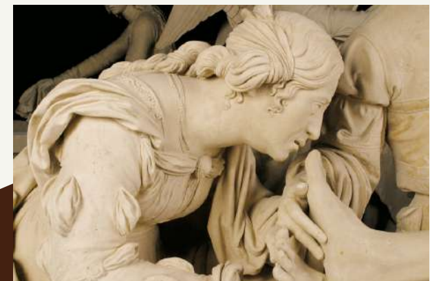
Sépulcre (détail), Ligier Richier, XVIe siècle, église Saint-Étienne, Saint-Mihiel

Pour vous aider dans votre visite en autonomie, un dossier pédagogique enseignant puis un dossier par élève vous sont fournis gratuitement. Si vous souhaitez être accompagné, l'Office de Tourisme « Coeur de Lorraine » propose une activité payante.