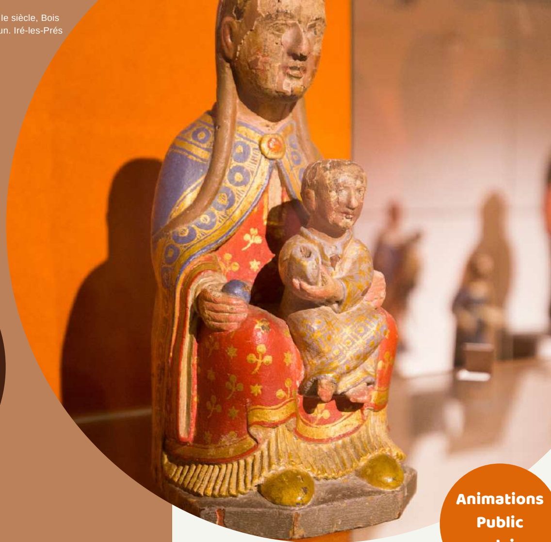
Vierge à l'Enfant, XIIIe siècle, Bois polychromé, Coll. mun. Iré-les-Prés