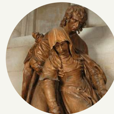
La Pâmoison de la Vierge, Ligier Richier, avant 1532, église Saint-Michel, Saint-Mihiel

Cette animation peut être complétée par une découverte du patrimoine Renaissance de Saint-Mihiel et de deux œuvres majeures du célèbre sculpteur, Ligier Richier, natif de la ville.